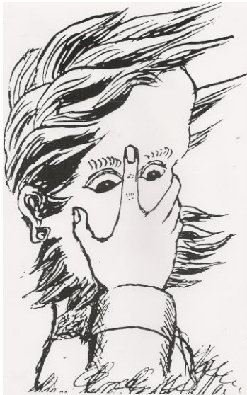
Autoportrait de L. Carroll